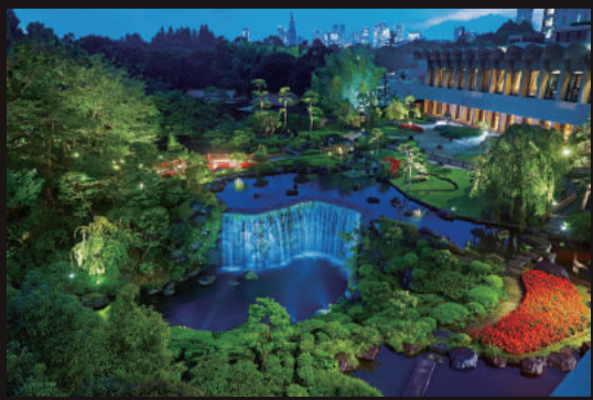
The Japanese garden at night / 日本庭園ライトアップ

400年余りの歴史を誇り、江戸城外堀に囲まれた約4万㎡の広大な日本庭園。四季折々の花々が咲き乱れ、樹木が濃い木陰をつくる池泉回遊式の庭園は、都心にありながら都会の喧騒から離れ、心ゆくまで日本情緒にひたることができる安らぎの場所です。